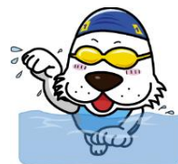
キャプテンわん