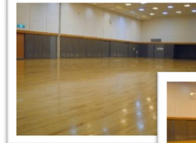
小アリーナ (上：全面 右：半面)