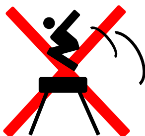
あん馬を台にして飛び降りる行為