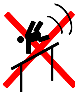
鉄棒を台にして飛び降りる行為