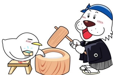
キャプテンわん (C) ゆず華（公財）横浜市スポーツ協会

横浜市スポーツ医科学センター TEL: 045-477-5050 FAX: 045-477-5052 ★住所: 〒222-0036 横浜市港北区小机町3302-5日産スタジアム内 ★ホームページ: http://www.yspc-ysmc.jp/ ★営業時間: 【月～土】9時～21時、【日・祝】9時～17時 ★休館日: 4～6月・9～12月第3火曜日、1～3月第3・4火曜日