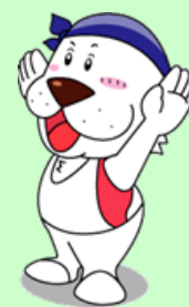
キャプテンわん © ゆず華 (公財)横浜市体育協会