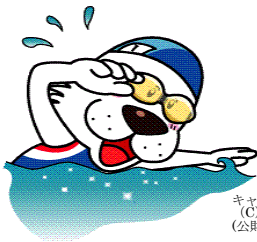
キャプテンわん (C) ゆず華、 (公財)横浜市体育協会