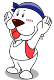
キャプテンわん (C) ゆず華 (公財)横浜市体育協会