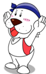
キャプテンわん （公財）横浜市体育協会

横浜市スポーツ医科学センターの体操指導員が、ご家庭でも練習ができるよう注意するポイント等を丁寧に指導します。