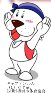
キャプテンわん (C) ゆず華 (公財)横浜市体育協会

横浜市スポーツ医科学センターの体操指導員が、跳び箱の開脚とびを丁寧に指導します。