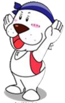
キャプテンわん (C) ゆず蔵 (公財)横浜市体育協会