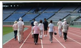
歩行トレーニング