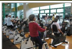
有酸素トレーニング