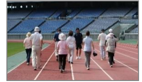
歩行トレーニング