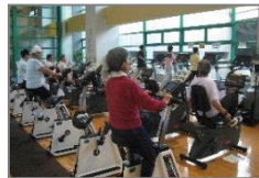
トレーニングプログラム