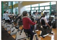
有酸素トレーニング