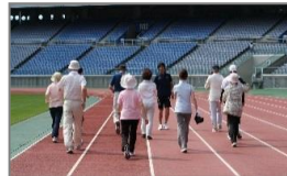
歩行トレーニング